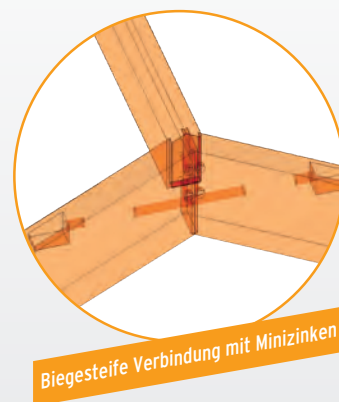
Biegesteife Verbindung mit Minizinken