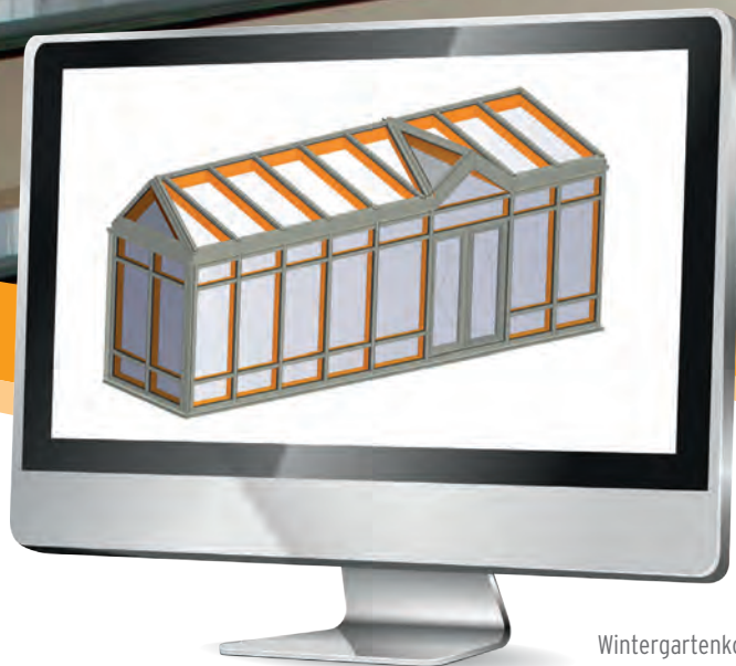
Wintergartenkonstruktion aus Holz-Alu

Erfassen Sie so „einfach“ wie ein Fenster eine Fassade oder einen Wintergarten aus Holz-Alu - egal was Ihr Kunde sich von Ihnen wünscht. Mit Klaes 3D haben Sie den idealen Begleiter, um selbst komplizierte Konstruktionen kinderleicht zu erfassen, professionell zu präsentieren, zu kalkulieren und anschließend rationell zu fertigen. Und das ohne CAD-Vorkenntnisse. Dank des flexiblen Datensystems können Sie Profile nahezu jeder Materialart in Ihr System einbauen.